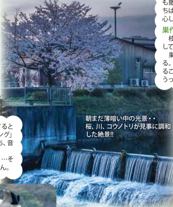
朝まだ薄暗い中の光景・・・桜、川、コウノトリが見事に調和した絶景!!

…「大すきだよ」「わたしも大すきよ」…そんな会話が交わされているかもしれません。