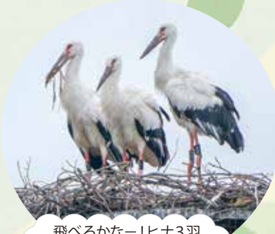
飛べるかなー!ヒナ3羽 (6月24日撮影)